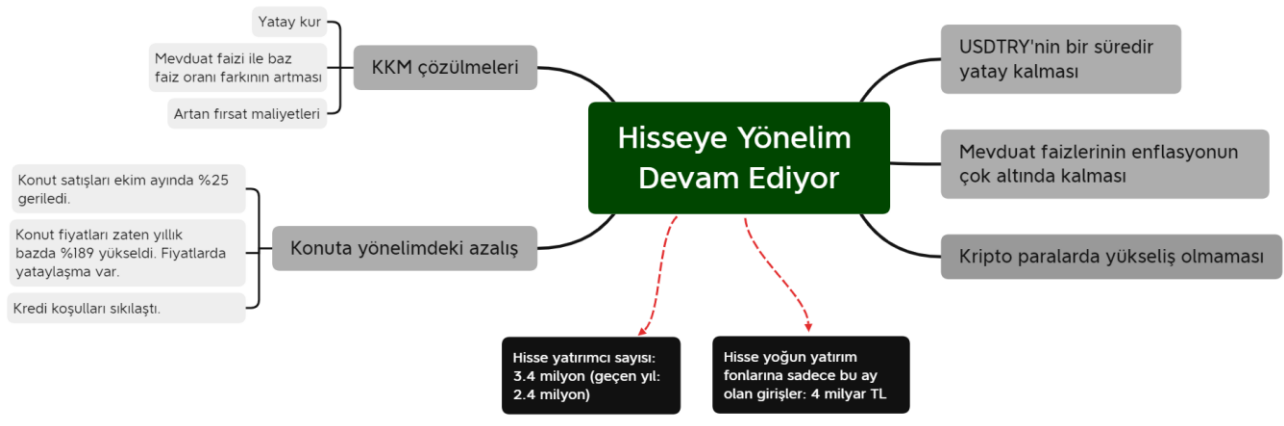
Şekil 2. Hisselere Yönelimi Destekleyen Etkenler

Türkiye’de negatif reel faiz ortamının olması, gayrimenkul fiyatlarında azalan yükseliş beklentileri, KKM tarafında artışların yavaşlaması ve USDTRY’nin bir süredir yatay seyretmesi fon akışlarını hisselerle yönlendirdi. Yabancıların çıkışları yerli yatırımcılar tarafından karşılandı ve yatırımcı sayısı son 12 ayda 1 milyon arttı. Bu yönelimin devam ettiğini işaret eden göstergeler portföylerde hisse taşımayı teşvik ediyor. Önümüzdeki dönemde yaygın bir yükselişten ziyade geride kalan ve resesyondan daha az etkilenen hisselerin yükseldiği bir dönem yaşanabilir.